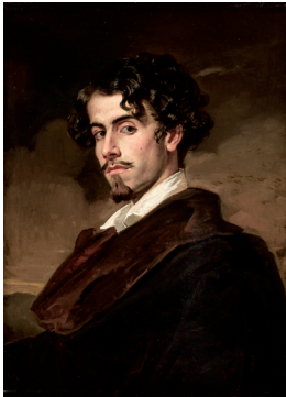
Gustavo Adolfo Bécquer