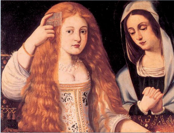
Retrato de "La Calderona"

La historia de las Damas de Comedia es decir de las mujeres en el teatro del Siglo de Oro comienza el día 17 de noviembre de 1587, fecha en que el Consejo de Castilla autorizaba la presencia de mujeres en los escenarios. Pero poniendo dos condiciones: la primera de ellas era que las actrices estuviesen casadas y fueran acompañadas por sus maridos; la segunda era que las dichas actrices siempre actuaran en ropa de mujer. A pesar de ser un mundo de hombres, algunas formaron parte del mundo teatral como actrices y también como empresarias, mecenas o escritoras.