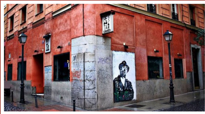
El Penta mítico lugar de la movida madrileña

Madrid se caracteriza por tener una amplia cantidad de locales donde poder escuchar la mejor música del momento.